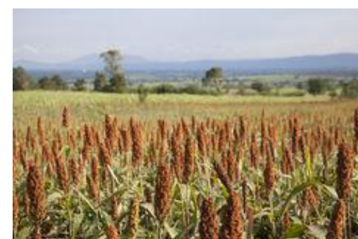
Champs de millet