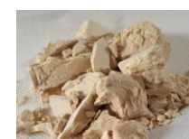
Levure de panification